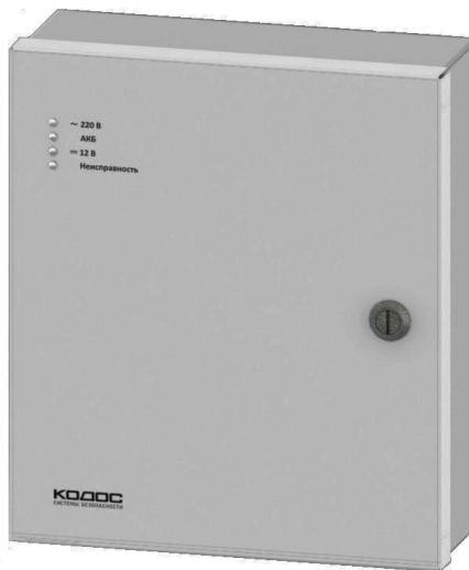
Рисунок 1 – Внешний вид ШМ

ШМ предназначен для работы в системах контроля и управления доступом (далее – СКУД), системах охранно-пожарной сигнализации. Основная функция ШМ – автоматическое открывание (разблокировка) дверей, оборудованных СКУД в случае возникновения на объекте аварийной ситуации (например, пожара).