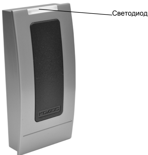
Рисунок 1 – Внешний вид считывателя

Считыватель предназначен для приема, обработки и передачи кода бесконтактных электронных кодоносителей стандартов EM-Marlin, HID и Temic в линию связи с управляющими устройствами серии «КОДОС» (например, контроллерами «КОДОС ЕС-202М», «КОДОС RC-102М», ППКОП «КОДОС А-20», и др.) и управляющими устройствами, работающими по протоколу «WIEGAND 26».