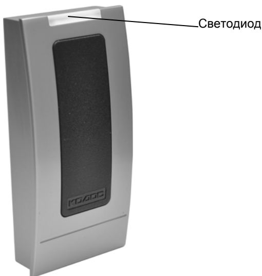
Рисунок 1 – Внешний вид считывателя

Считыватель предназначен для приема, обработки и передачи кода бесконтактных электронных кодоносителей стандарта Mifare в линию связи с управляющими устройствами серии «КОДОС» (например, контроллерами «КОДОС ЕС-202М», «КОДОС РС-102М», ППКОП «КОДОС А-20», и др.) и управляющими устройствами, работающими по протоколу «WIEGAND-26».