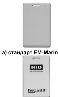
а) стандарт EM-Marlin