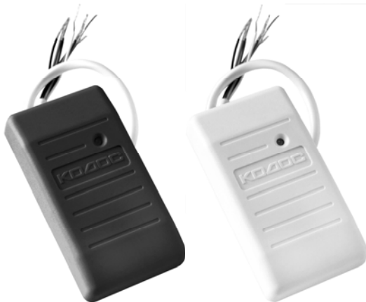
Рисунок 1 – Внешний вид считывателя

Считыватель предназначен для приема, обработки и передачи кода бесконтактных электронных кодоносителей стандартов EM-Marlin и HID в линию связи с управляющими устройствами серии «КОДОС» (например, контроллерами «КОДОС ЕС-202М», «КОДОС RC-102М», ППКОП «КОДОС А-20», и др.) и управляющими устройствами, работающими по протоколу «WIEGAND-26».